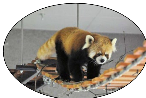
まるやまどうぶつえん 円山動物園のレッサーパ

あつ よわ ンダは、暑さにとても弱い なつ れいぼう ゆき かつよう ので、夏の冷房に雪を活用 しています。