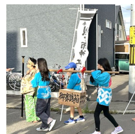
▲賽銭箱を担ぐ子どもたち