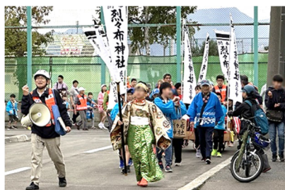
▲先頭の狩衣姿が何とも凛々しい

9月14日・15日、烈々布神社の宵宮祭と例大祭が開催されました。15日には、栄中央第一町内会と元園町内会による「子ども神輿」のパレードが実施されました。集まった子どもたち総勢約40名余りは、おそろいの青い法被を着て神輿を引きます。先頭の子は狩衣姿で、幟を立て神輿と太鼓を引いて広い町内エリアを練り歩きます。先導者のスピーカーからは、「子ども神輿が通ります。」