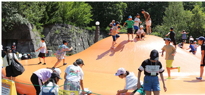
▲大人気遊具「オレンジエッグ」で元気いっぱい飛び跳ねる子どもたち

帰路の道路で事故があり、迂回のため、バスの到着が40分余り遅れましたが、参加者には事故もなく、自然と緑を満喫したツアーになりました。