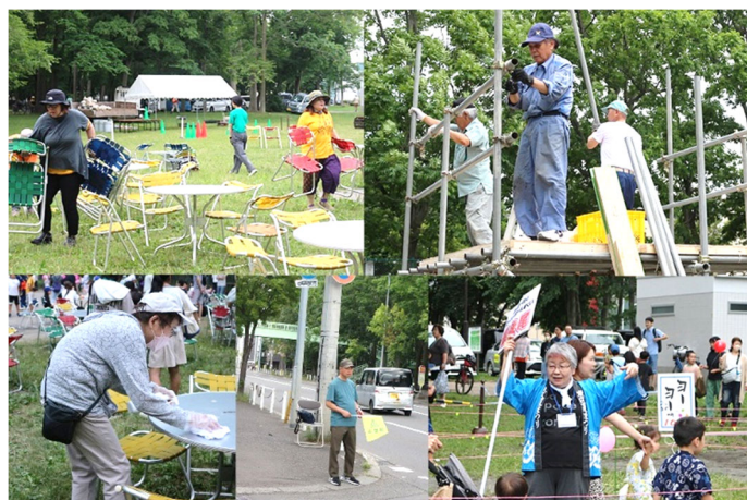
▲運営に携わっていただいた大勢のみなさん