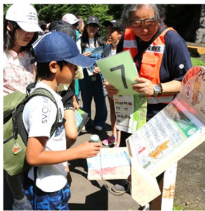
▲クイズラリーで滝野の秘密を発見!

午後からは、森のすみかを探訪です。秘密の抜け道をくぐると出てくる森の中に、子どもたちが喜びそうな自然を利用した遊具がいっぱいです。地下水をくみ上げる山小屋、森の中のツリーハウス、大きなきのこの下に木琴があるメロディーきのこのこ、迷路や滑り台など、時間を忘れて遊んでいました。また、子どもたちはクイズラリーにも挑戦し、スタンプを集めたご褒美に公園オリジナルステッカーを受け取り大喜びでした。