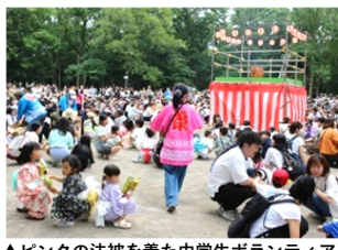
▲ピンクの法被を着た中学生ボランティア

盆踊りには、地域で大切にしたいものがいっぱい詰まっています。中高生と高齢者が一緒になって運営し、世代を超えた繋がりが生まれたことでしょう。北海盆踊り普及連合会や盆踊り教室の受講生が踊りの輪を先導してくれたのも盆