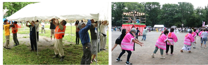
▲重労働でも、力を合わせて素早くテントを設営 ▲踊りの輪を先導する盆踊り教室受講生たち

踊りが結んだ縁であり、子どもや親世代も楽しく踊るきっかけを作ってくれました。地域団体のイベントに大勢集まる子どもたちへのお土産のお菓子は、75 団体(個人)から頂いた協賛金(568,000 円)を使わせていただきました。また、地区内の道路工事を担う株式会社米山土建のみなさんに、会場の設営と撤去作業をお手伝いいただきました。地域の町内会、各種団体、企業と個人のみなさんが、子どもたちへの思いをつぐんで盆踊りに結集した結果と言えますよう。