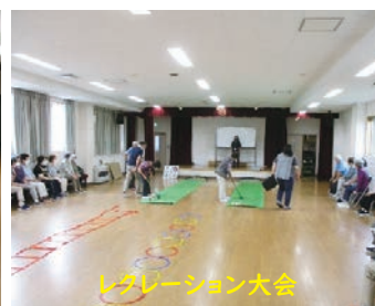
レクリエーション大会