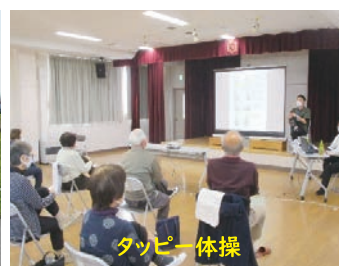
タップダンス体操