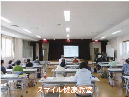
スマイル健康教室