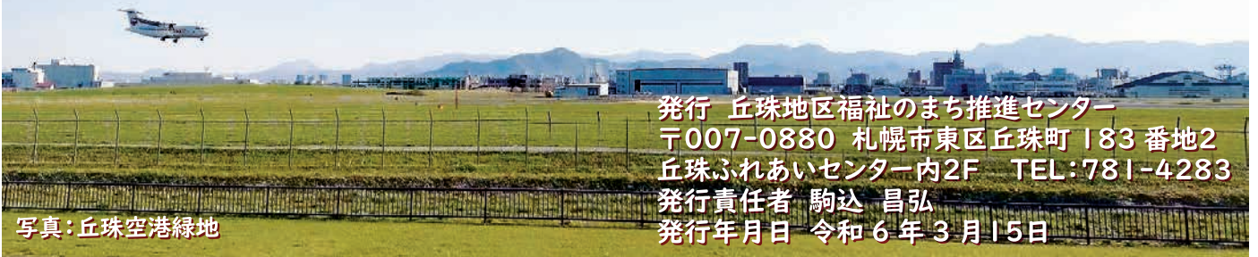
写真:丘珠空港緑地

発行 丘珠地区福祉のまち推進センター 〒007-0880 札幌市東区丘珠町183番地2 丘珠ふれあいセンター内2F TEL:781-4283 発行責任者 駒込 昌弘 発行年月日 令和6年3月15日