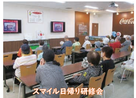
スマイル日帰り研修会